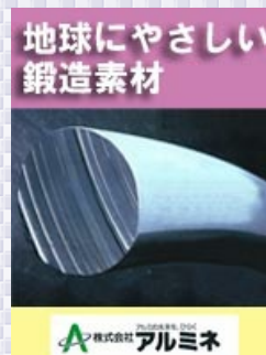
地球にやさしい 鍛造素材